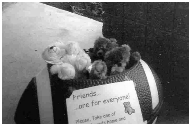
Invitan los niños a para llevar "un amigo"

Un periodista de Foster's Daily Democrat llegó para hacer reportaje del suceso, más o menos cuando llegó "La Globera". Para leer el informe acerca del suceso, vayan a www.Fosters.com y chequeen el artículo con fecha de 3 del agosto, 2006. Se titula el artículo "Family Members of Strafford County Jail inmates treated to BBQ" (Se les regala una barbacoa a los miembros de las familias de los presos de la Cárcel del Condado de Strafford).