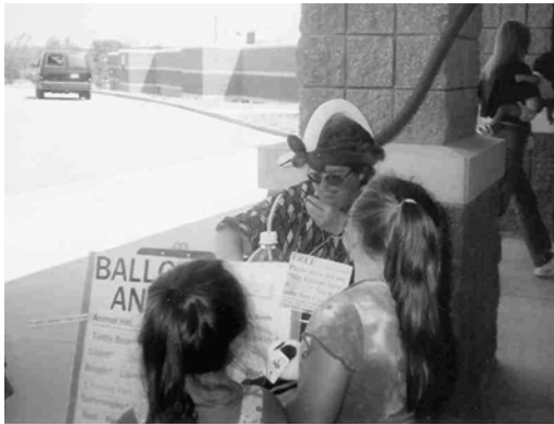
La "señora del globo" encanta a niños

de ositos de peluche regalados por Hugs Across America, y llegó poco antes de la barbacoa.