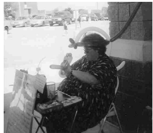
La "señora del globo" trabaja en una creación.